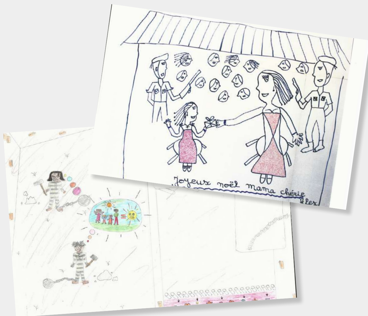
Dessin d'enfant à son parent incarcéré exposition organisée par le Relais Enfants-Parent asbl

Nous laissons ces enfants grandir dans un gouffre affectif et institutionnel – une violence invisible, mais ravageuse.